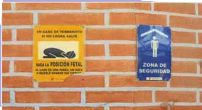
Señalización en la UE

Aunque se ha dotado de materiales y equipo necesario para situaciones de emergencia, el uso adecuado de los mismos (Ej, extinguidores y sirenas ) no esta aun probado. En el caso de los extinguidores, el 2011 solo la cocinera , secretaria y profesores de computación recibieron un curso de cómo usar este equipo, conocimiento que no ha sido compartido y menos probado.