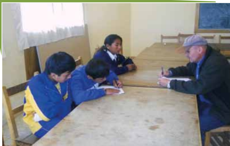
Entrevista al Gobierno Escolar de una UE

Para complementar y reforzar la información proporcionada durante las entrevistas a los distintos actores, se realizaron visitas de campo con el fin de observar los resultados de manera directa en las UE.